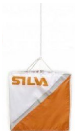
Prisma de treinos 10x10 cm