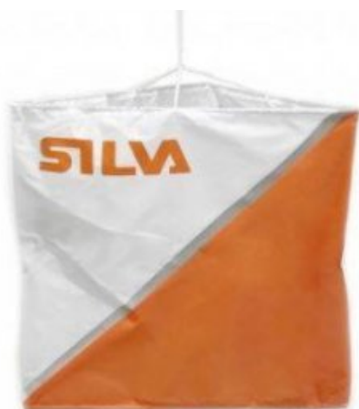
Prisma normal 30x30 cm